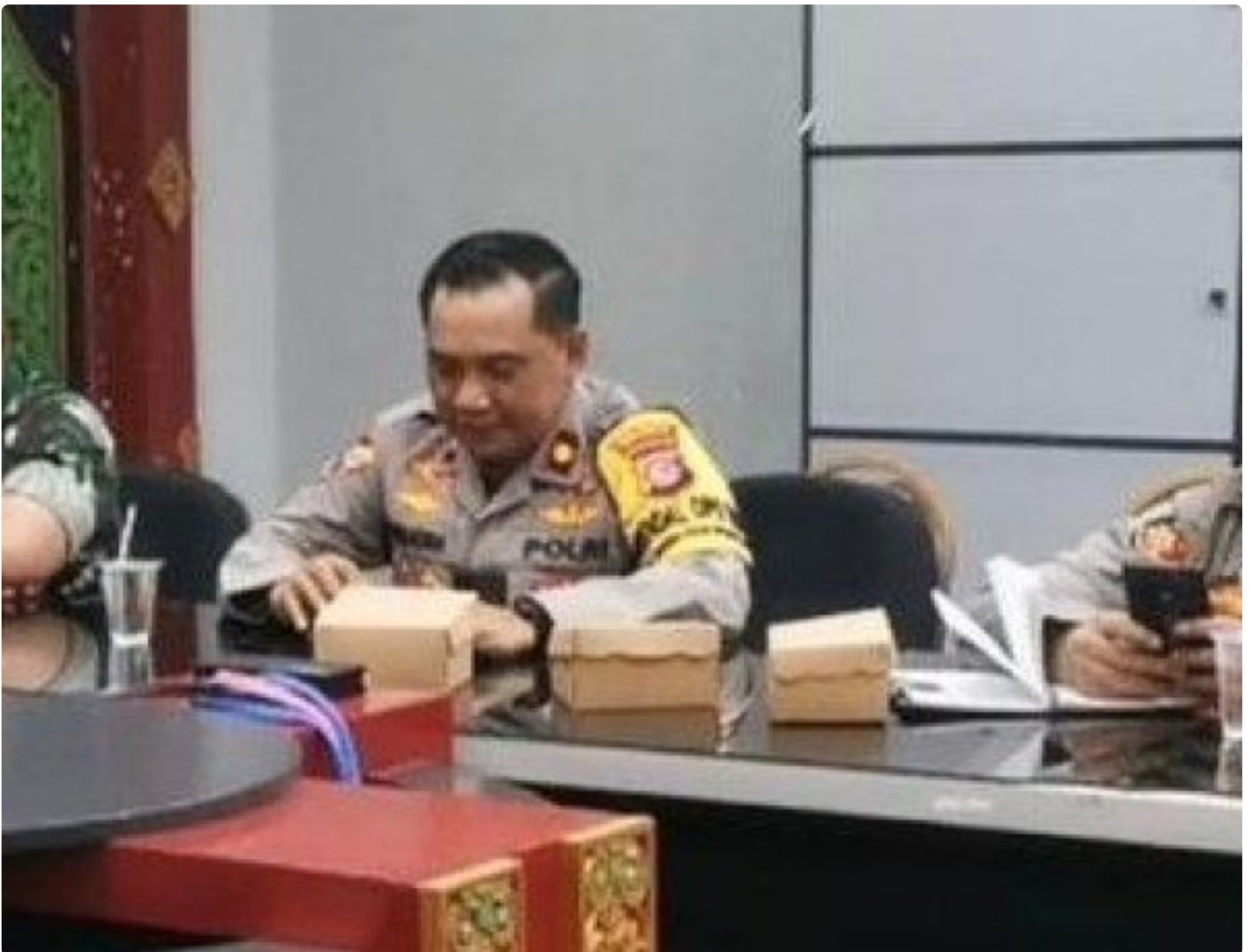
Kabagops Polresta Mataram saat menghadiri Rakor di Kantor Bupati Lombok Barat, Selasa (10/12/2024)